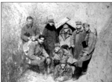
Gránátmentes fedezék bejárata előtt. Kol-Korytoi állás 1916. március 1-jén